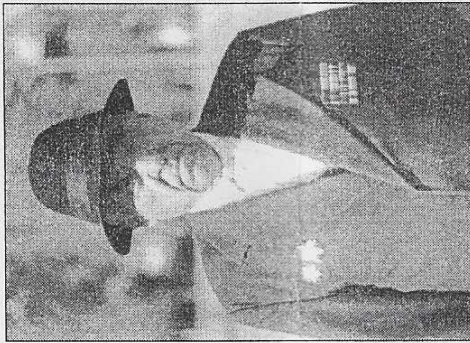
Бывший разведчик в День Победы - 9 мая 2001 года.

вин, пешком через Ладогу пробирался в Ленинград. Его определили в разведчики 292-го артиллерийского полка 128-й стрелковой Псковской Краснознаменной дивизии, воевавшей на Синавинском направлении.